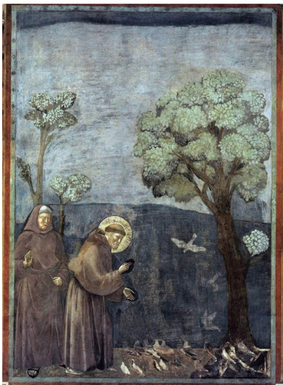
Kazanie do ptaków (autor Giotto di Bondone, ok. 1295-1299 - fresk)