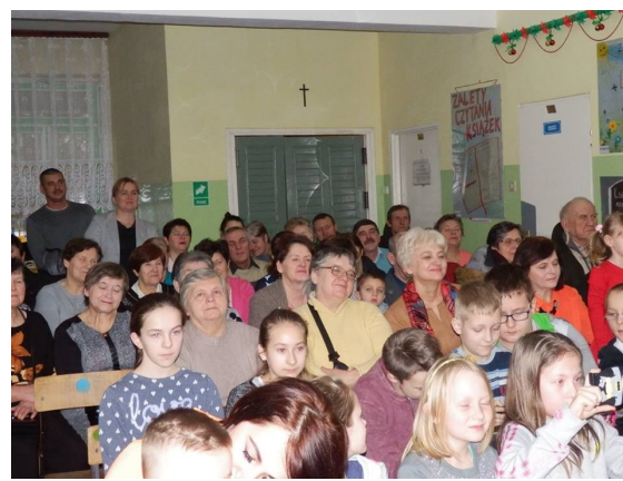
stawowa w Sewerynowie