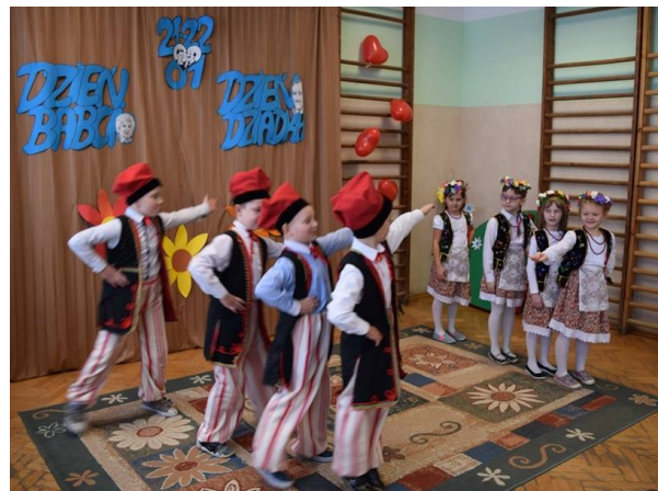
Szkoła Podstawowa w Pniewniku