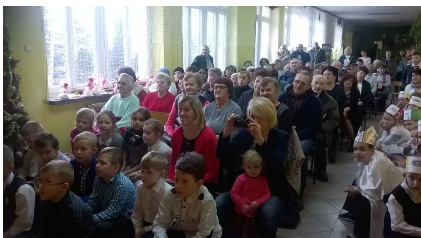
Szkoła Podstawowa im. ks. bpa Franciszka Jaczewskiego w Górkach—Grubakach